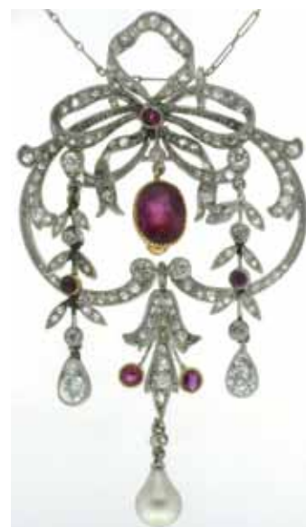
Broche, 1910. Collection Rocks &amp; Clocks.