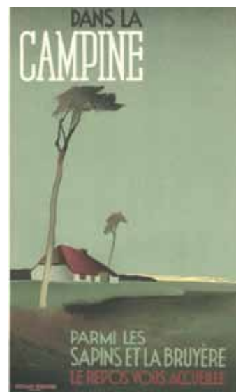
Herman Verbaere, affiche Dans la Campine , 1937.

A nouveau, l'asbl Interbellum a son espace réservé à la Verbeke Foundation pour sa 6e Collectors Items : une foire abordable et de qualité, de collectionneurs pour les collectionneurs. Les membres d'Interbellum Belgique, France et Pays-Bas présentent leurs peintures, livres, sculptures, textiles, affiches, petits mobiliers, curiosités et objets divers en argent, céramique, bakélite et verre, notamment. Ces objets remontent à l'entre-deux-guerres mais pas seulement, puisque l'Art nouveau, le design des années 50 et 60 et même l'art ethnique et contemporain y sont présentés. Sympa, l'accès pour 5 € à toutes les expositions de la Verbeke Foundation. Actuellement, outre la collection permanente, se tient également 'Twelve Thousand Three Hundred Forty-Five' et les expos de Francesco Fransera, Jacobus Kloppenburg et Andrée Arty.