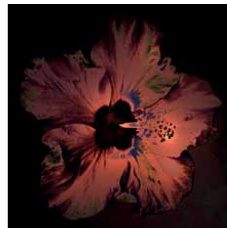
Katja Koevoet, Imagine , tirage sur dibond, 100 x 100 cm.

La première édition de ce salon a plu et l'événement est donc reconduit au cœur du World Fashion Centre d'Amsterdam. S'y déploient plus de 1700 œuvres de 350 artistes contemporains de tous styles, matériaux et disciplines, qui vendent en direct à des prix défiant toute concurrence. Un bon de réduction à imprimer sur le site internet de la foire vous donne droit à une ristourne de 5 € à l'entrée.