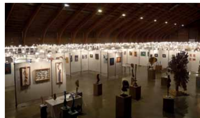
Image d'ambiance du salon Libr'Art.