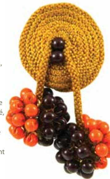
Les bijoux vintage de Miriam Haskell sont très demandés. Cette affiche illustre un 'clip robe' en corde tressée et perles.

The Amsterdam Tribal & Antique Jewelry Fair devient The Amsterdam Traditional Jewelry & Textiles Fair. Aux côtés de créations artisanales d'Afrique, d'Amérique, d'Asie et d'Europe, on propose également des textiles. Pourquoi, en effet, ne pas combiner un châle en cachemire avec une belle broche ? Du côté des bijoux européens et américains, on verra notamment des créations de Miriam Haskell datant de 1926 à 1960, période de sa collaboration fructueuse avec le créateur Frank Hess. Nouveauté, le salon développe une section intitulée 'Responsabilité sociale des entreprises', laquelle rassemble des stands qui accordent une attention particulière à la création dans une perspective durable. Il s'agit par exemple de bijoux créés au départ de matériaux existant ou sur base du commerce équitable. Attention, le salon ferme ses portes à 17h !