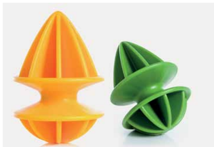
Quentin de Coster, Citrangé . © Royal VKB. Dans l'exposition 'Homologie', le jeune design belge se dévoile par le biais de 20 objets contemporains. À voir à l'Espace Wallonie-Bruxelles lors de Design September.