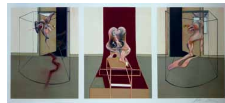
Francis Bacon (1909-1992), triptyque inspiré d' Oresteia van Aeschylus , 1981, lithographie sur papier, 53 x 104 cm. Collection Gilden's Art Gallery.