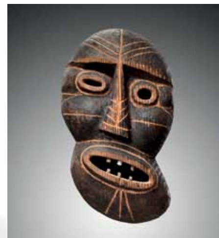
Masque, Groenland oriental. Début 20 e siècle. Bois. Hauteur : 23 cm. Ancienne collection Ib Geertsen, Danemark. Collection Serge Schoffel, Bruxelles.

Un voyage autour du monde en six jours, c'est ainsi que l'on pourrait décrire le Parcours des mondes. Les amateurs et collectionneurs d'art ethnographique se rendront donc chez les