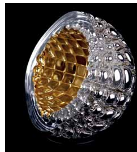
Arnout Visser, Bubbels , 9 x 12 cm, 2012. Prix : 195 €

Libr'Art Halle aux Foires Libramont www.expolibrumont.com du 22 au 30-09