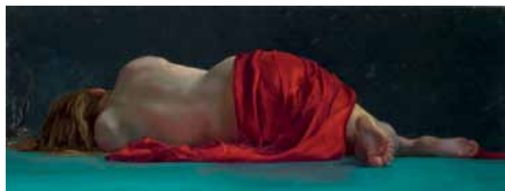
Marten Huisling, Rouge allongé , huile sur panneau, 70 x 26 cm. Collection Galerie Lauswolt.